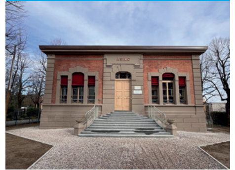
Impianto Sportivo Toscanella