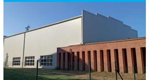
Palestra Scuola Secondaria Toscanella