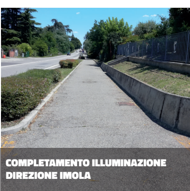
COMPLETAMENTO ILLUMINAZIONE DIREZIONE IMOLA